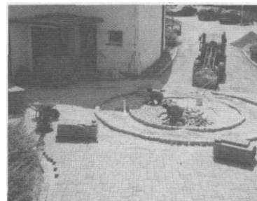
Pflasterer bei der Arbeit