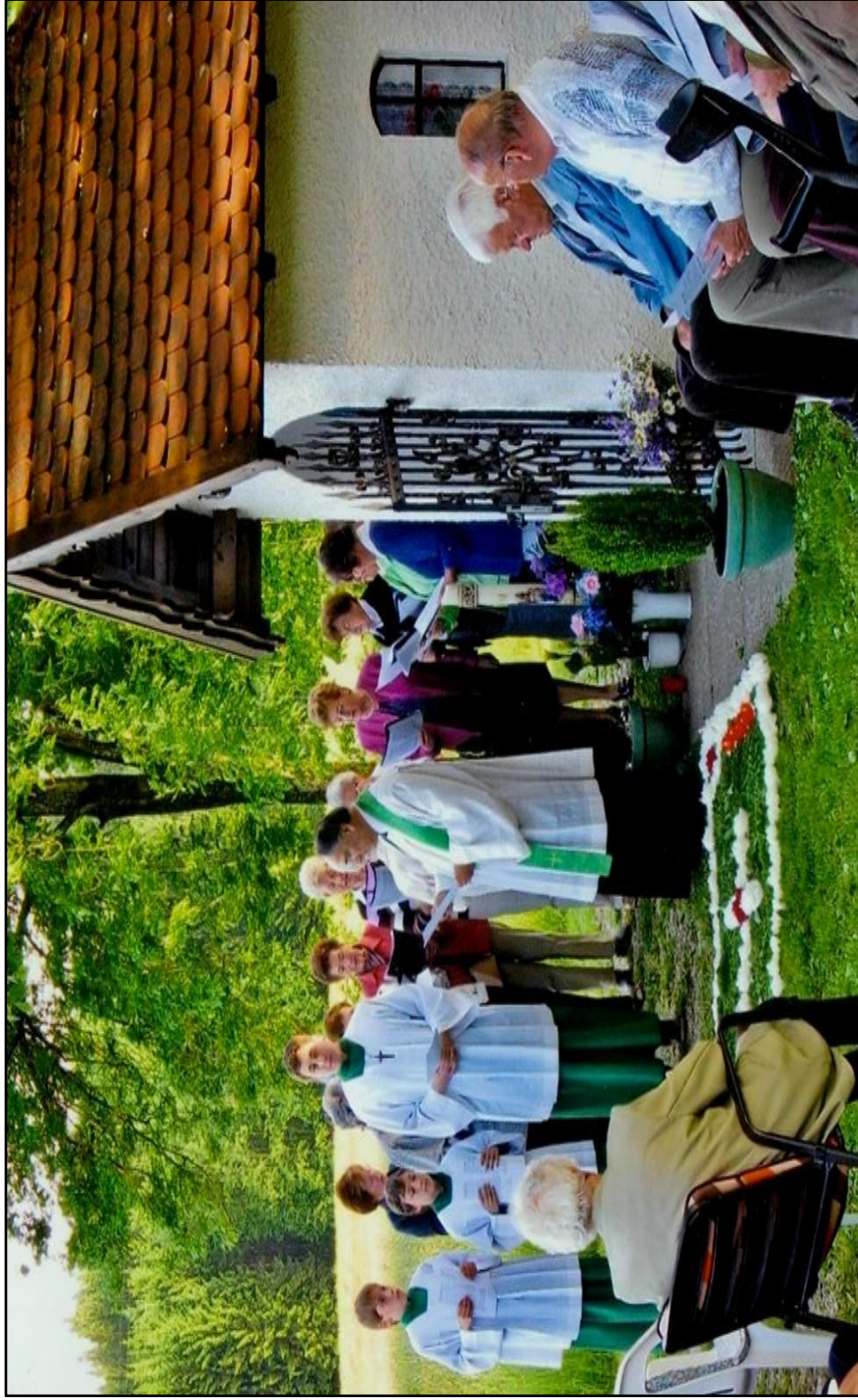
Maiaandacht an der Stadlerkapelle Sperrwies