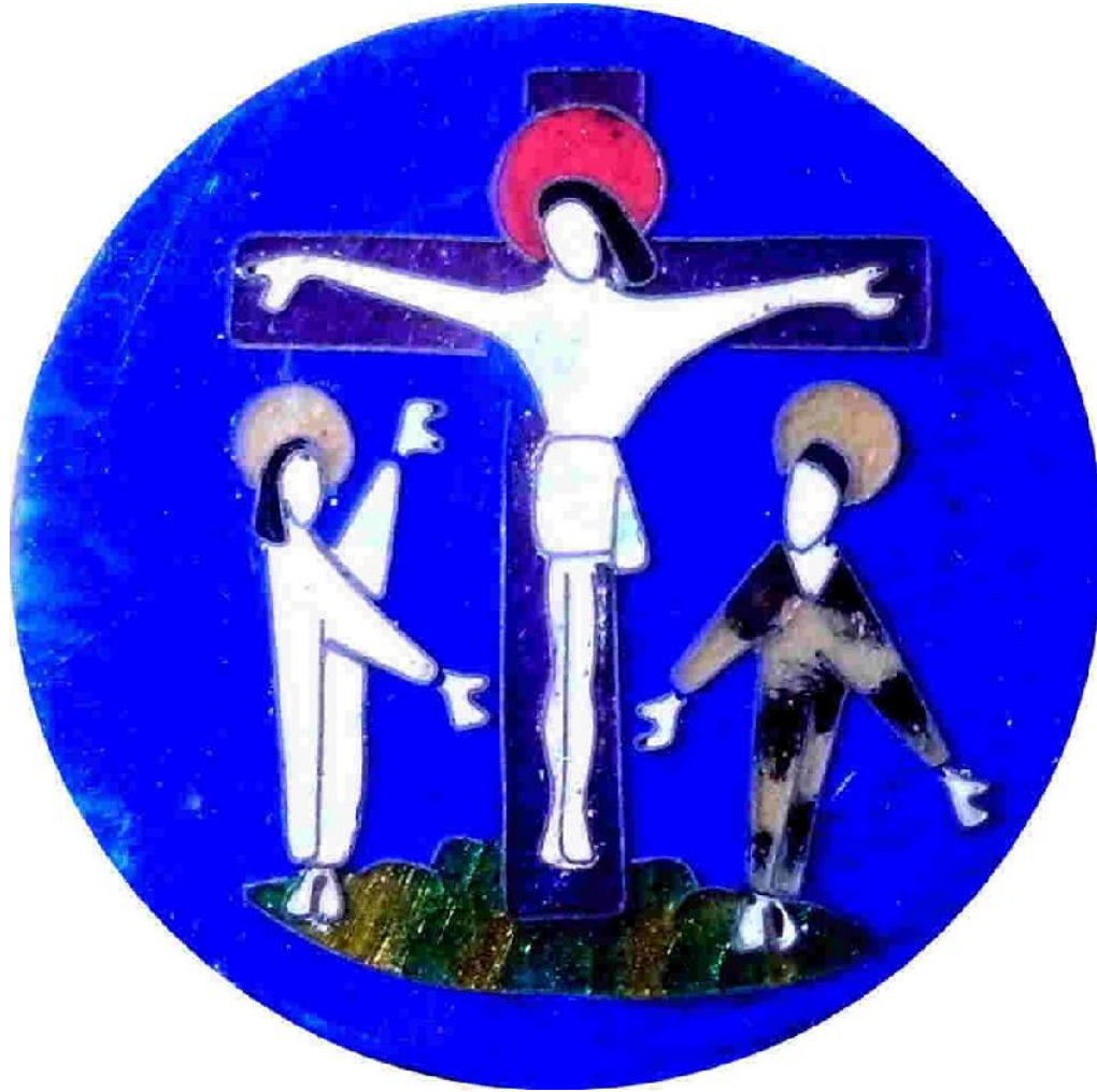
Kreuzigungsmedaillon von Renate König-Schalinski