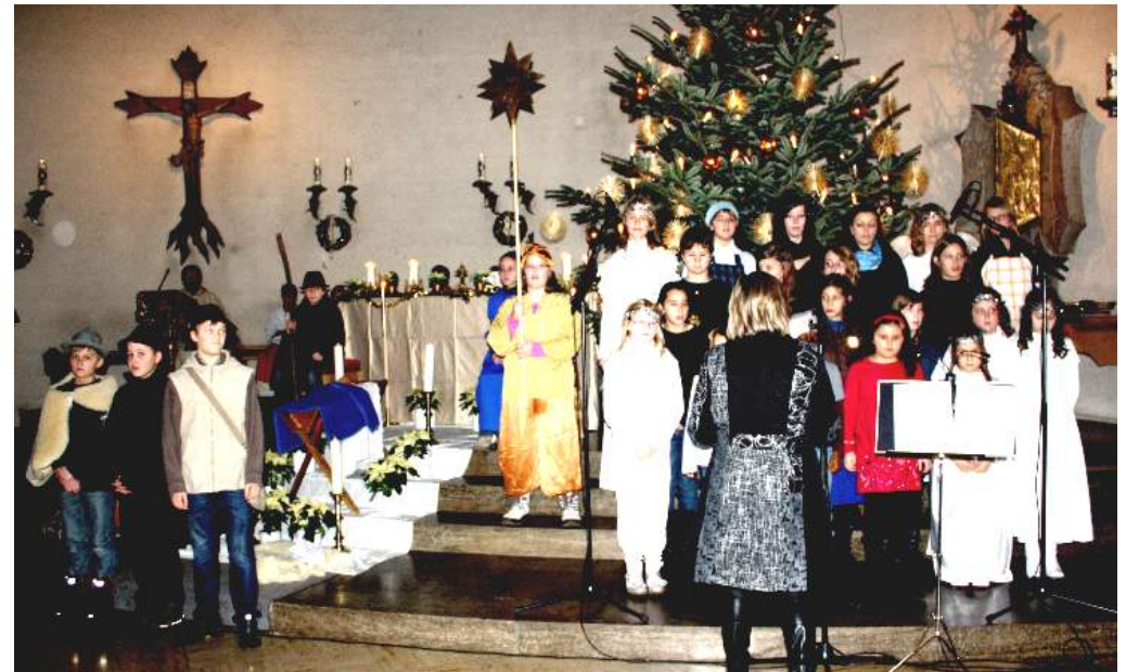
Regenbogen-Kids gestalteten die Kindermette Carmen/Alex. Vilsmeier

Traditionell gestalteten die Regenbogen-Kids am Heiligen Abend wieder die Kindermette. Die Botschaft von der Geburt Christi wurde von den Kindern und Jugendlichen auf wunderbare Weise in die Neuzeit übertragen. „Jetzt habe ich es auch verstanden – Weihnachten ist nicht in erster Linie das Fest der Geschenke, sondern das Fest der Nächstenliebe“ – mit diesen Worten beenden die jungen Menschen das Krippenspiel und stimmen das Lied „Halleluja“ von Leonard Cohen an. Dabei wurde es plötzlich ganz still in der überfüllten Kirche und alle waren berührt von diesem Lobgesang.