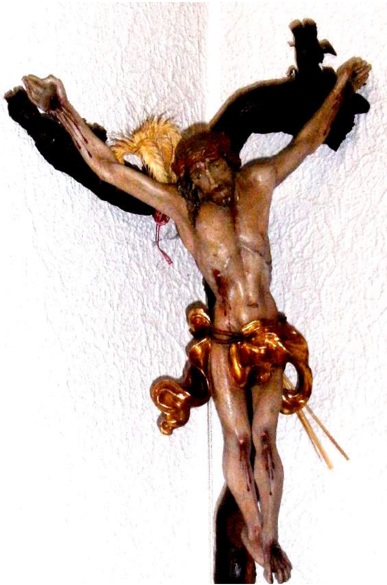
„Christus am Kreuz“ von Holzschnitzer Gerhard Haas