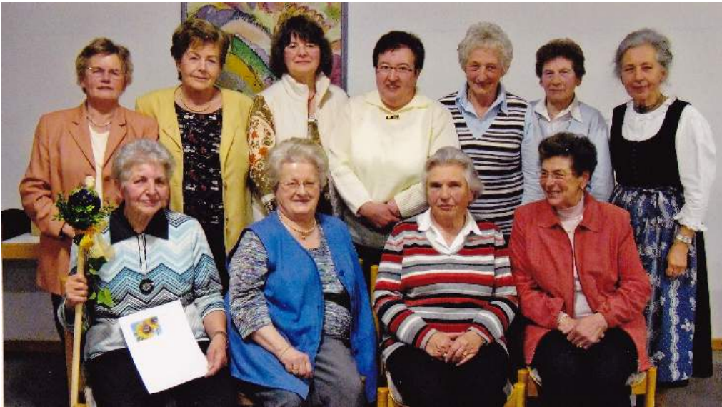
Bild: Vorstand des Neustifter Frauenbundes nach der Neuwahl am 7.4.2008

Der Katholische Deutsche Frauenbund in der Pfarrei Neustift wurde 1971 gegründet und kann somit in diesem Jahr sein 40-jähriges Jubiläum feiern.