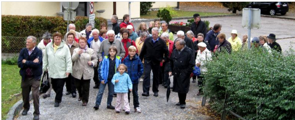
Pfarrausflug nach Kremsmünster – Lambach - Stadl-Paura