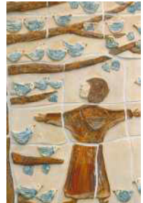
Foto: Getöpferes Bild am Eingang unseres Kinderhauses (von Frau Wahleder)

„Er besitzt ein Auge, ein Ohr und vor allem ein Herz für die einfachen Dinge im Leben. Mit seinem Herzen vermag er zu hören, zu schauen, zu fühlen, was eine Blume zu sagen hat, ein blühender Zweig, ein uralter Stein. Er versteht das Lied der Vögel und den Gesang einer sprudelnden Quelle, des Windes und des Feuers. Alles wird zum Fenster, zur Tür, durch die er dem begegnet, der alles geschaffen hat, Himmel und Erde. Alles wird ihm zur Antwort auf die Frage: Gott ich will dich suchen, finden, zeige mir, wo bist du da!“