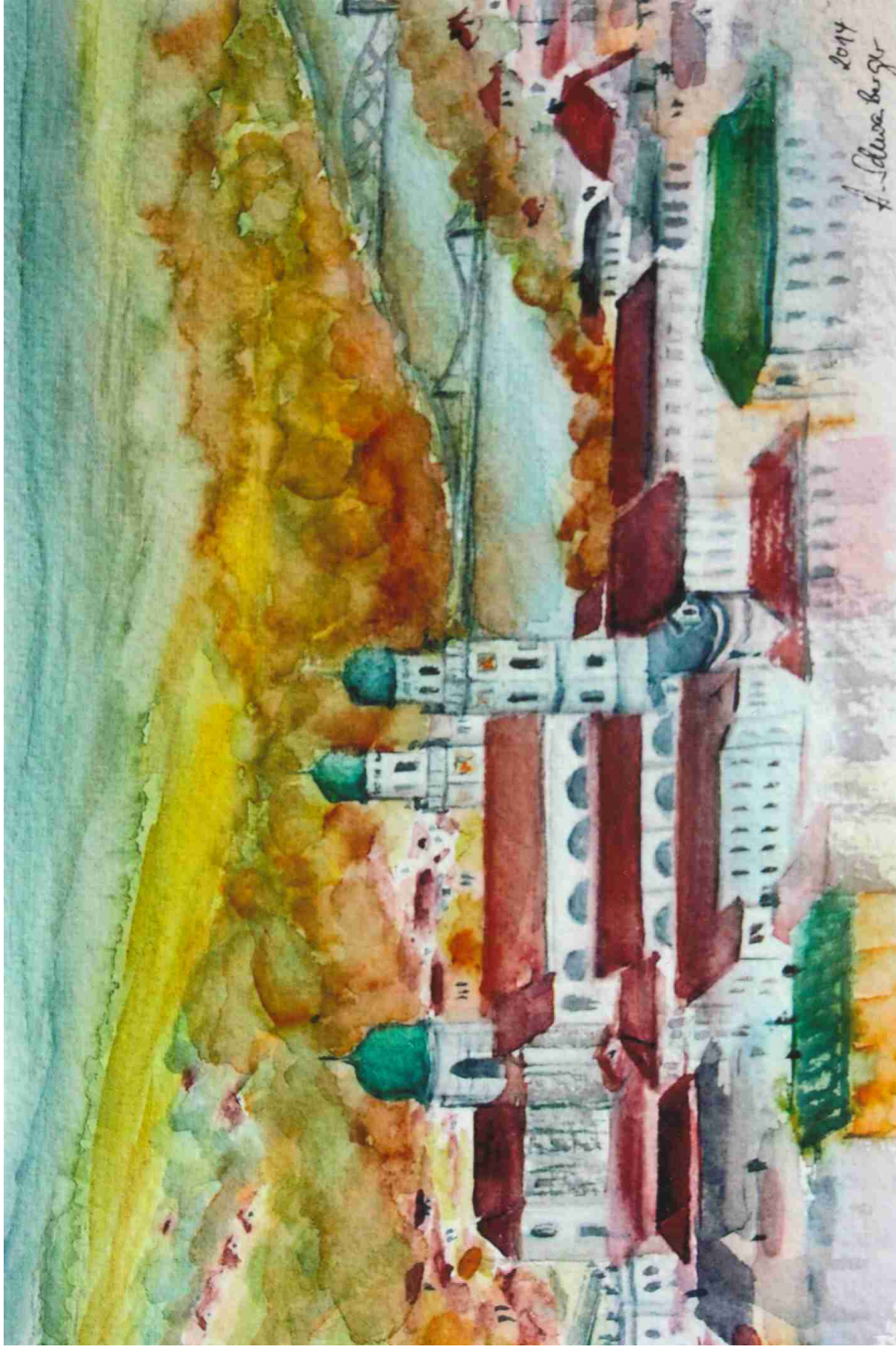
Pfarrbrief 3 – 2015 vom 1.6.2015 bis 31.7.2015 - Pfarrverband Neustift-Auerbach