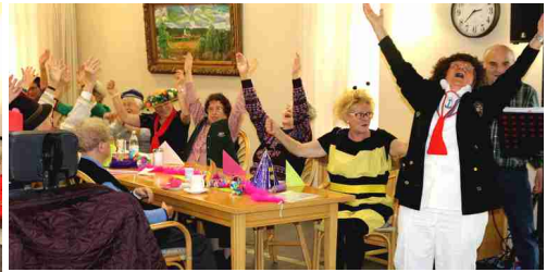
↑ Auftakt mit der sog. "Franz. Rakete" ⇐ Auftritt der Kinder-Prinzengarde von Bad Höhenstadt